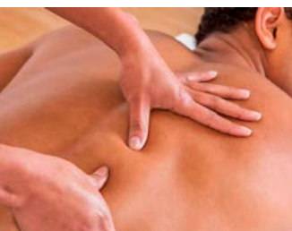
Masaje Tejido Profundo