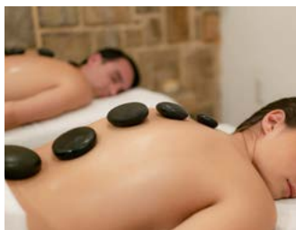
Masaje Sagrado de Piedras Calientes